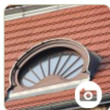
Okno w dachu, różne wariacje