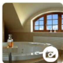
Lukarny z Oknoplastu